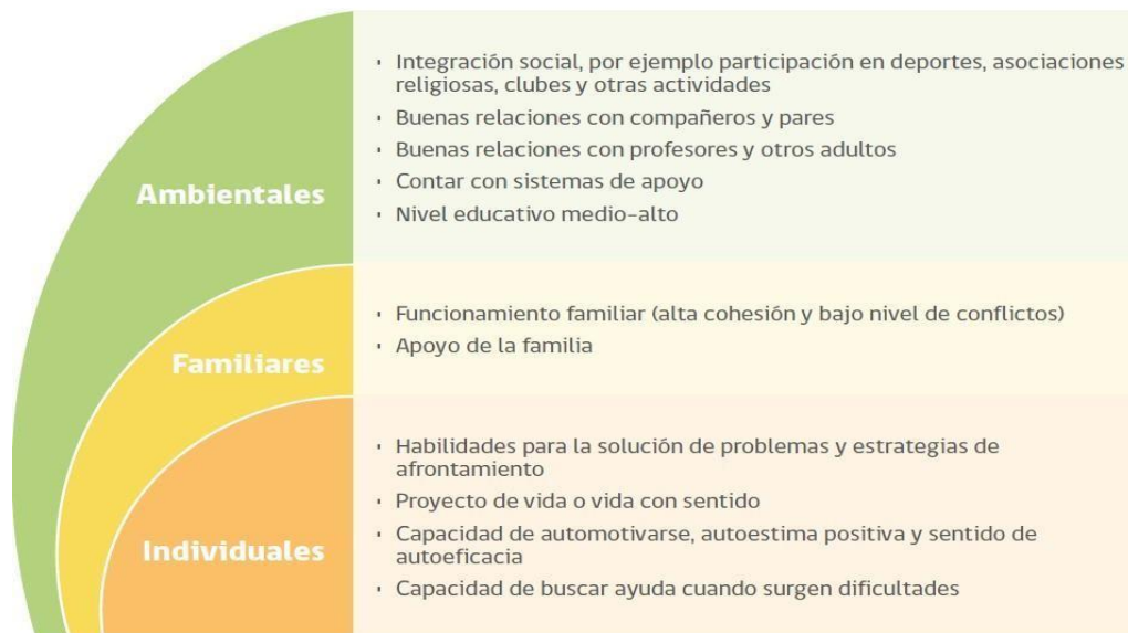
FIGURA 2. FACTORES PROTECTORES CONDUCTA SUICIDA EN LA ETAPA ESCOLAR