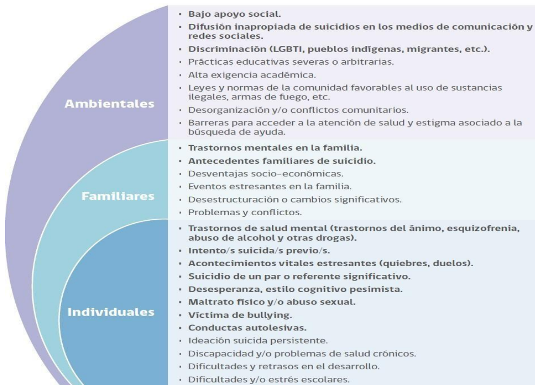
FIGURA 1. FACTORES DE RIESGO CONDUCTA SUICIDA EN LA ETAPA ESCOLAR